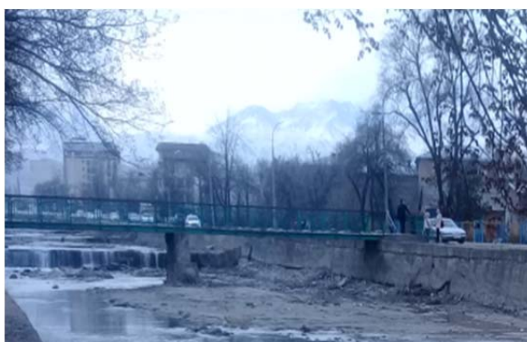
1-сүрөт. Ахунбаев көчөсүнөн төмөнүрөөк, Ала-Арча дарыясынын көрүнүшү