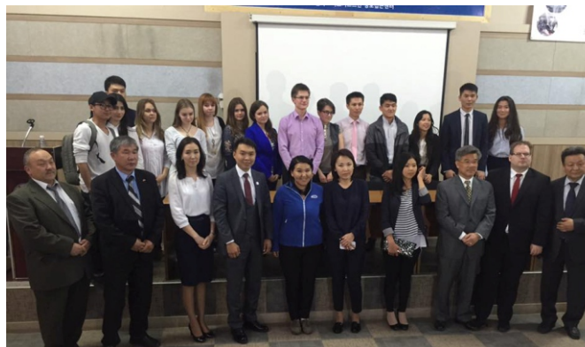
Участники международной конференции «Логистика - вектор развития».

Учебный процесс студентов ориентирован, в основном, на самостоятельную работу, для которой предоставлено: