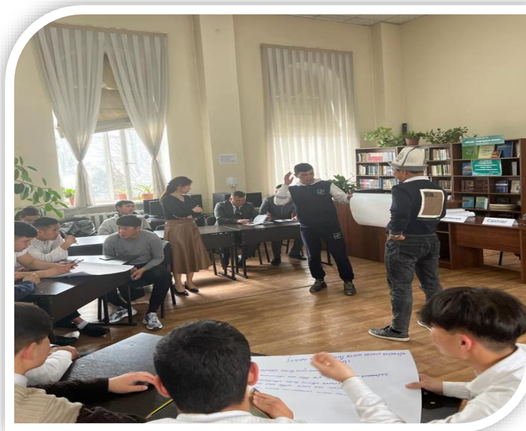
Топтордун талкуусу кызуу жүрүүдө