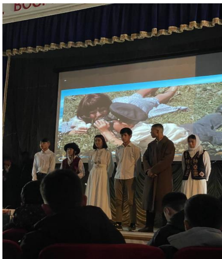
Ч.Айтматовдун чыгармаларынан үзүндү аткарышууда