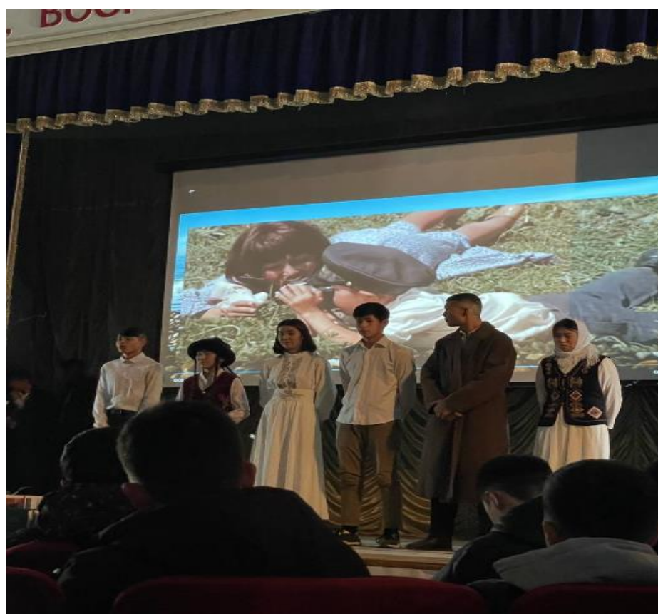
Ч.Айтматовдун чыгармаларынан үзүндү аткарышууда