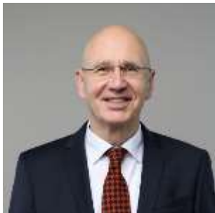
Werner Ullman- ВНТ президенти