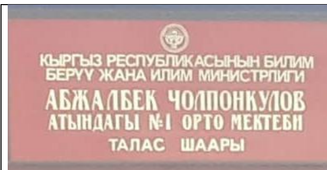
Фото отчет г. Талас